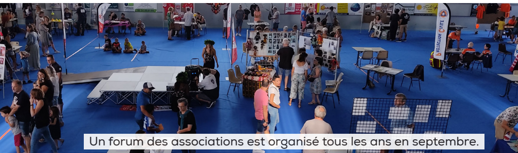
Un forum des associations est organisé tous les ans en septembre.

La commune est riche de multiples associations sportives, culturelles, scolaires ou de loisirs. Les bénévoles y sont les bienvenus. Engagez-vous !