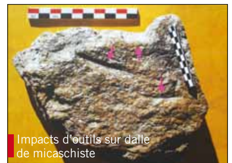
■ Impacts d'outils sur dalle de micaschiste