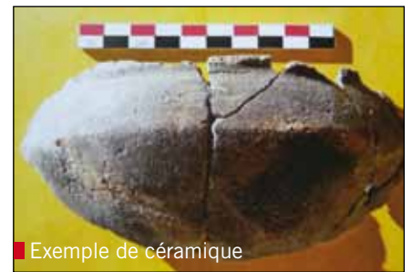
■ Exemple de céramique