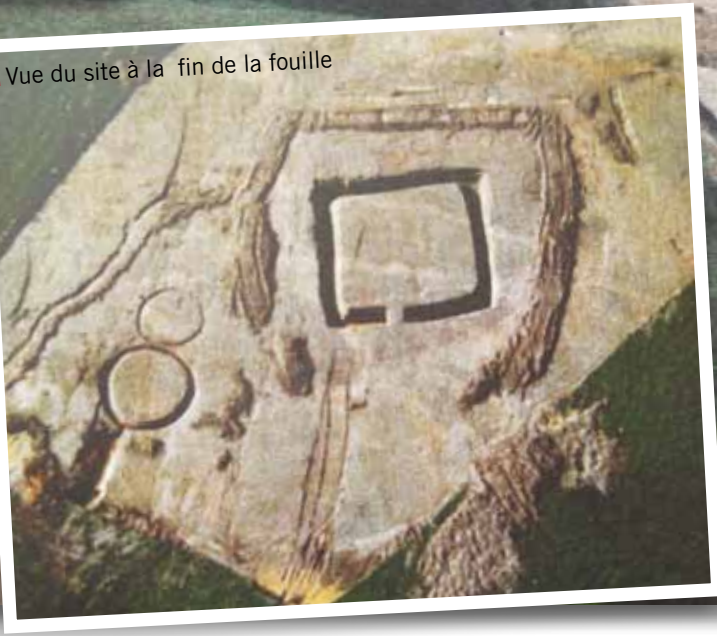
■ Vue du site à la fin de la fouille